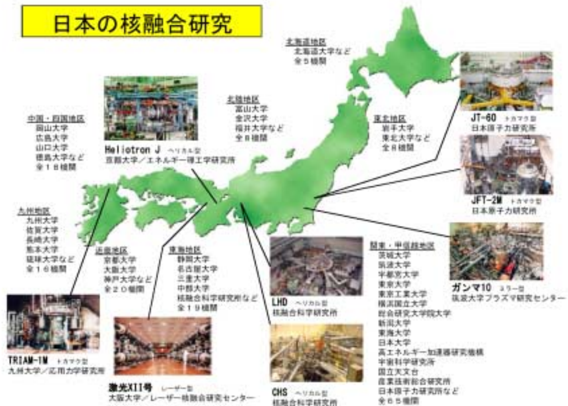
図2 我が国の核融合研究拠点