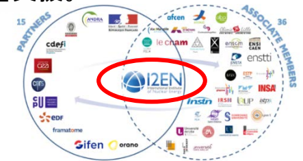
産官学連携による人材育成の推進

産官学のステークホルダーが連携して、国内で提供される教育プログラムの情報を集約するハブ機関 (I2EN) を設置。