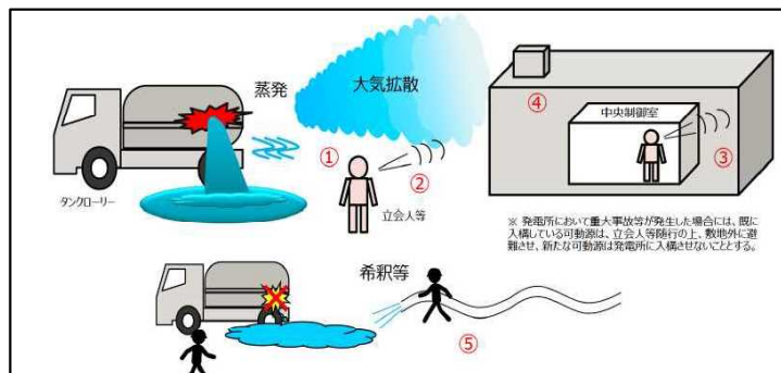
出典：第752回原子力発電所の新規制基準適合性に係る審査会合資料1-1-1 ( http://www2.nsr.go.jp/data/000278937.pdf ) から抜粋

可動源からの有毒ガスに対しては、可動源に立会人を随伴させ、有毒ガスの発生を発見した場合には、原子炉制御室運転員への連絡、換気設備の隔離、防護具の着用を行う手順等を整備する。