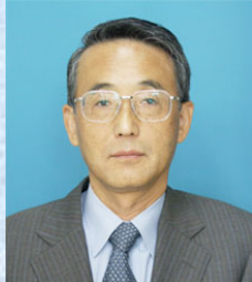
原子力委員会委員長代理 田中 俊一 (元日本原子力研究 開発機構特別顧問)