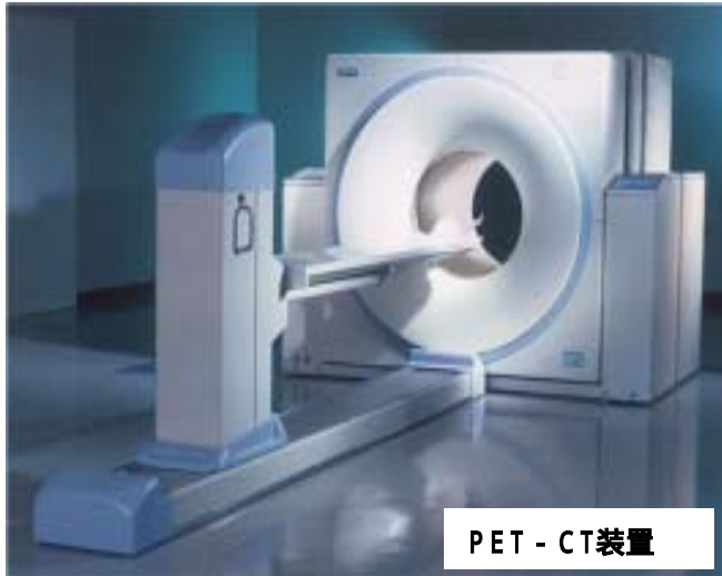
PET - CT装置

がん細胞など特定の部位に集積する特性を有する短半減期の放射性医薬品(陽電子を放出するブドウ糖薬剤など)を患者に投与し、その体内分布を撮影。がんの早期発見などが可能。平成14年時点で国内病院に56台