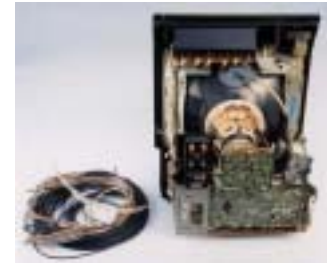
ラジアルタイヤ、耐熱電線