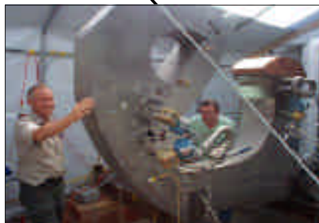
ダイバータカセット組み合わせ試験