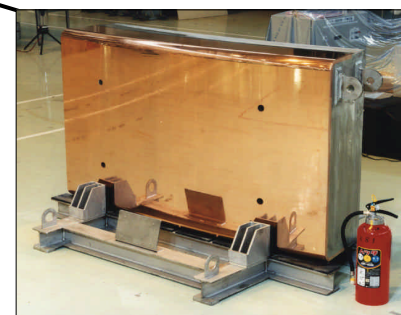
遮蔽ブランケット実規模モックアップ試験