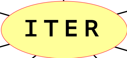
ダイバータカセット遠隔保守技術開発