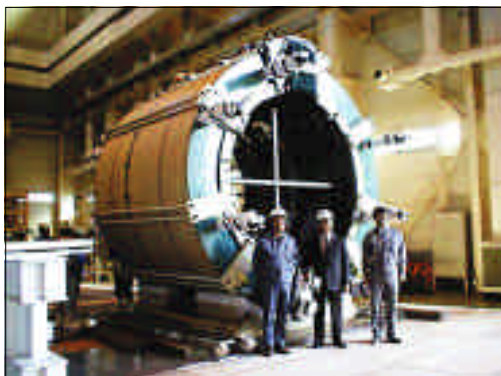
中心ソレノイドモデルコイル試験