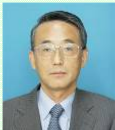
原子力委員会委員長代理 田中 俊一 (元日本原子力研究 開発機構特別顧問)