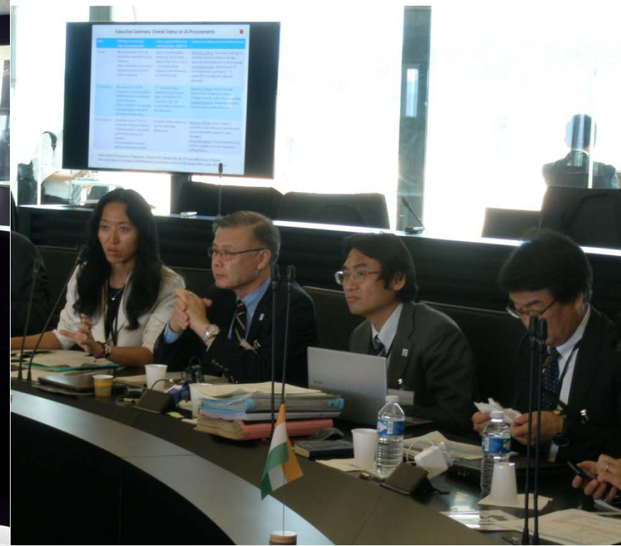
＜第14回ITER理事会の様子＞