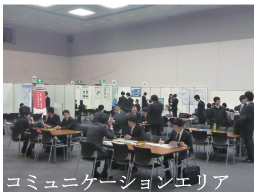
コミュニケーションエリア