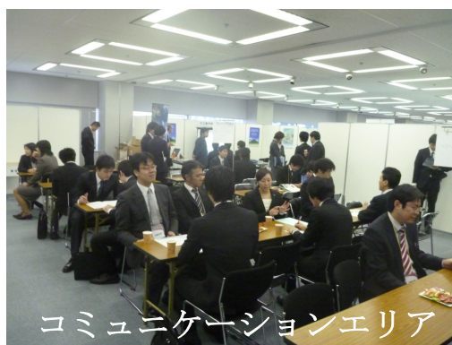
コミュニケーションエリア