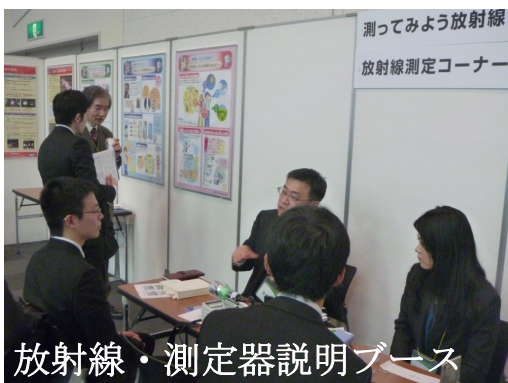
放射線・測定器説明ブース