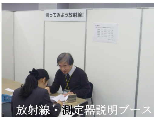
放射線・測定器説明ブース