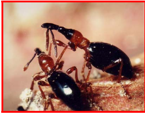
アリモドキゾウムシ