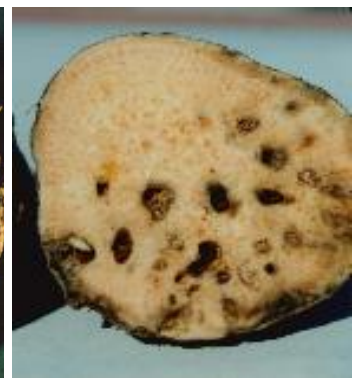
サツマイモの被害 （左：アリモドキゾウムシ、右：イモゾウムシ）