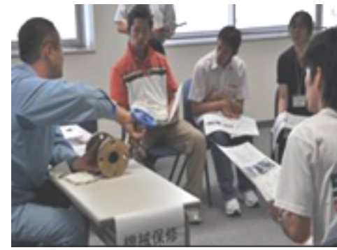
現地技術者との交流