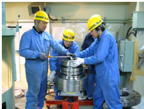
モックアップ設備を使用した訓練