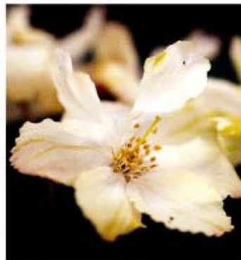
花びらがうすらと黄色く色ついたサクラの新品種「桃姫王」

素イオンを照射し、接ぎ木により育てた。このうちの1本の系統は、温室で栽培すると季節を問わず一年中、花をつけた。野外では、春と秋の二つの季節に咲いた。ピンクの二重の花をつける新品種は、いつも咲くという。