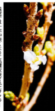
温室では一年中咲くように調整されたサクラ＝東京都千代田区の理化学研究所東洋連絡事務所で14日