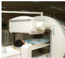
病院でのがん診断