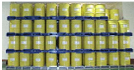
原子力機構における廃棄物保管状況