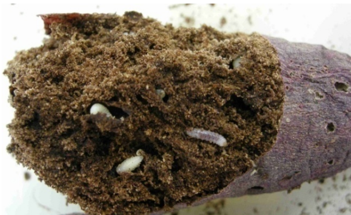
サツマイモの被害 （アリモドキゾウムシ）