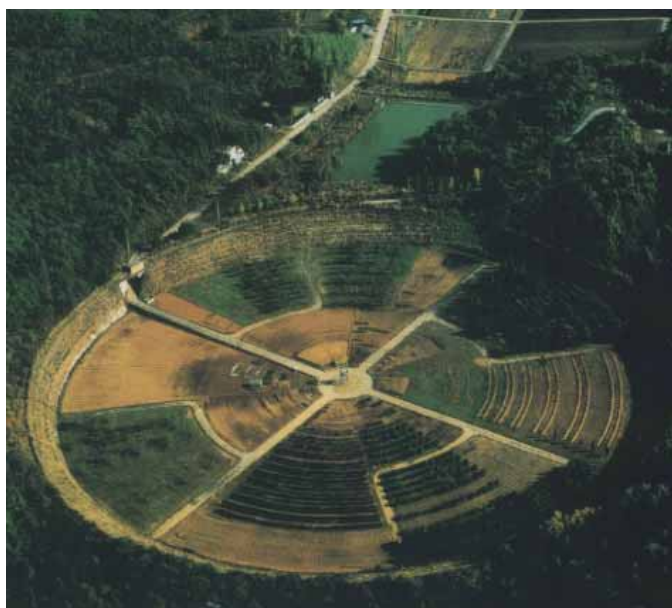
ガンマフィールド（東京ドームとほぼ同じ大きさ）