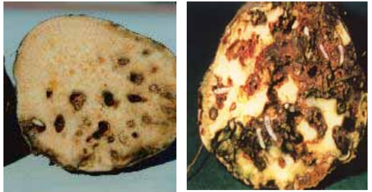
サツマイモの被害

イモゾウムシ、アリモドキゾウムシに寄生された初期のサツマイモは、外見から寄生の判別は容易ではなく、これら害虫の早期発見、早期防除は困難である。幼虫によりイモ内部が食害されると、サツマイモ自体が産生する物質により、悪臭や苦みを生じ食用にならないばかりか、家畜の飼料にもならない。