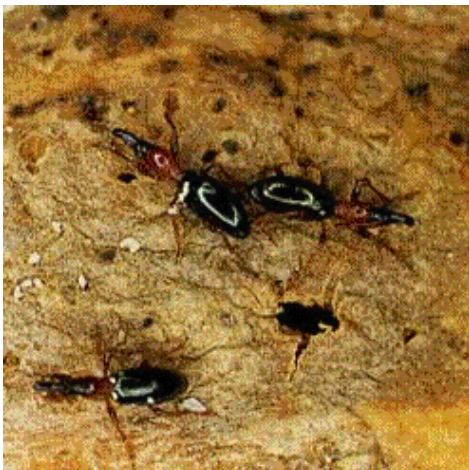
アリモドキゾウムシ

成虫はイモや茎の表面に産卵し、幼虫は内部を食害する。食害を受けたイモは悪臭と苦みを生じ、食用や飼料にもならない。 （体長5～7mm）