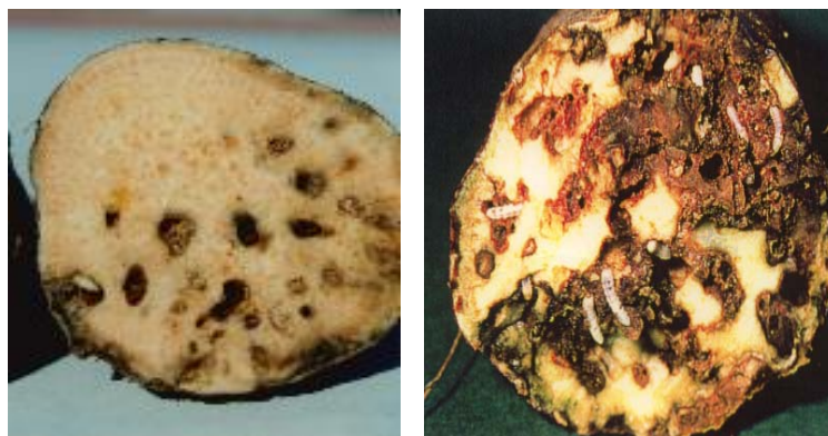
サ ツ マ イ モ の 被 害

イモゾウムシ、アリモドキゾウムシに寄生された初期のサツマイモは、外見から寄生の判別は容易ではなく、これら害虫の早期発見、早期防除は困難である。幼虫によりイモ内部が食害されると、サツマイモ自体が産生する物質により、悪臭や苦みを生じ食用にならないばかりか、家畜の飼料にもならない。