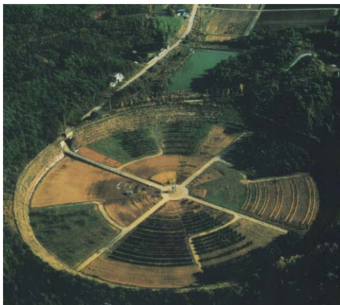
ガンマーフィールド（東京ドームとほぼ同じ大きさ）