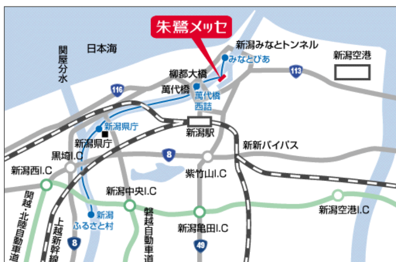
(新潟駅周辺拡大図)