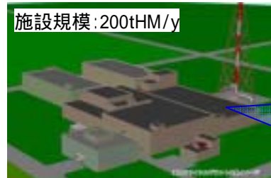
燃料サイクル施設