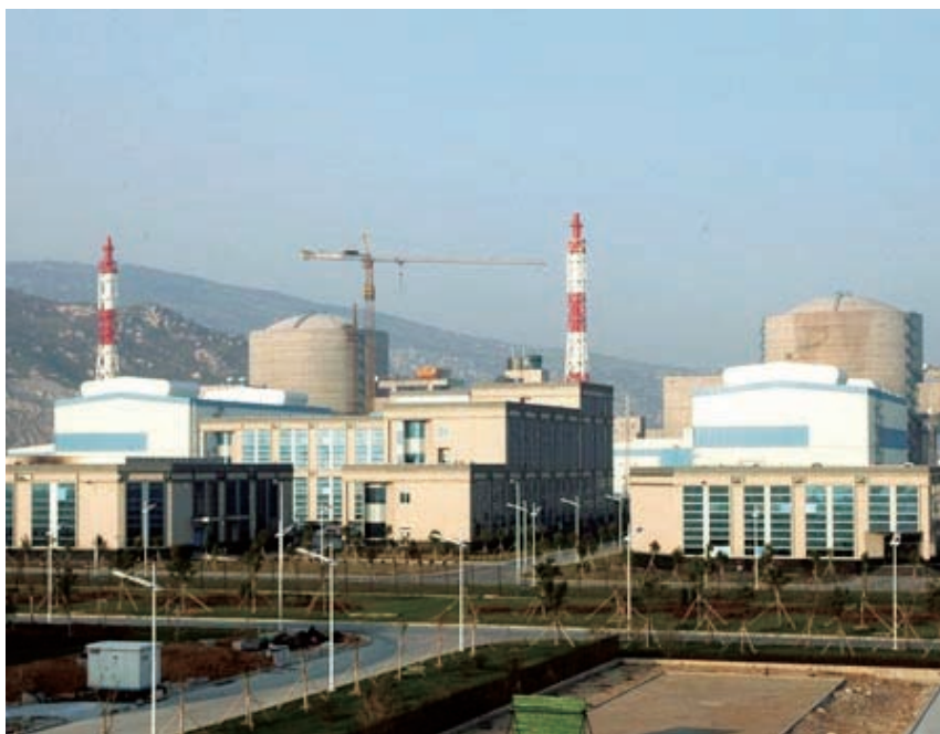
図6 中国 田湾原子力発電所