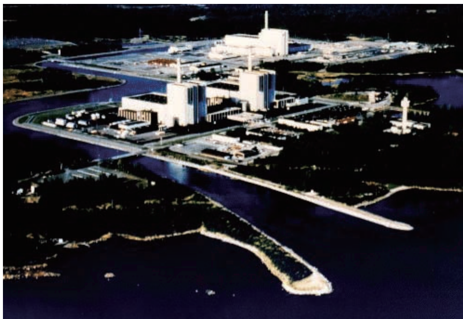
図2 スウェーデン フォルスマルク発電所