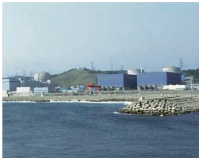
図5 韓国 蔚珍原子力発電所