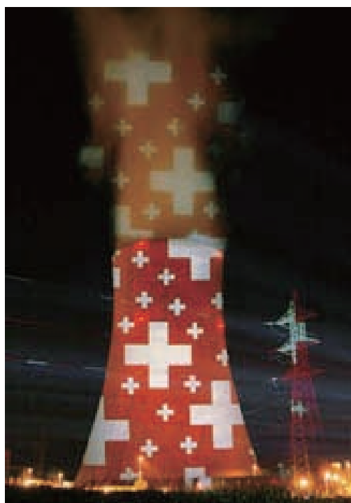
図3 スイス ゲスゲン発電所