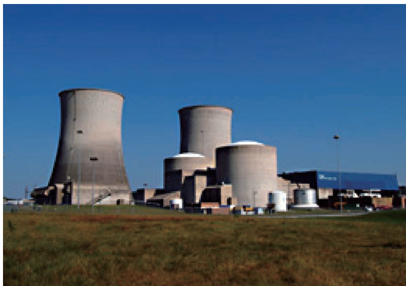
図1 ワッツバー2号機

2002年にブッシュ大統領は、高レベル放射性廃棄物の地下処分場をユッカマウンテンとする計画を承認し、2008年6月に米国エネルギー省（DOE）からNRCに対してユッカマウンテン処分場建設の許可申請が行われた。