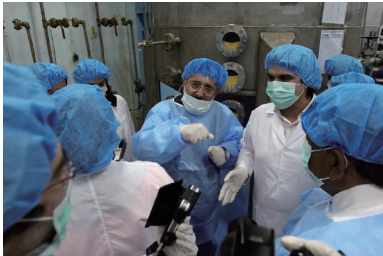
イランによるイスファハンのウラン転換施設の公開（平成19年（2007年）2月）